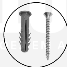
BUCHAS E PARAFUSOS