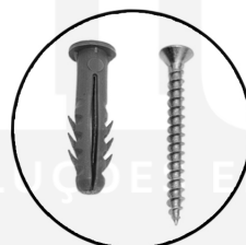
BUCHAS E PARAFUSOS