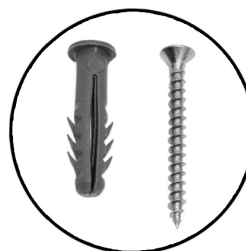
BUCHAS E PARAFUSOS