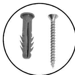
BUCHAS E PARAFUSOS