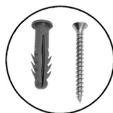
BUCHAS E PARAFUSOS